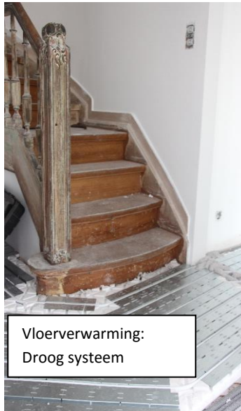
Vloerverwarming: Droog systeem