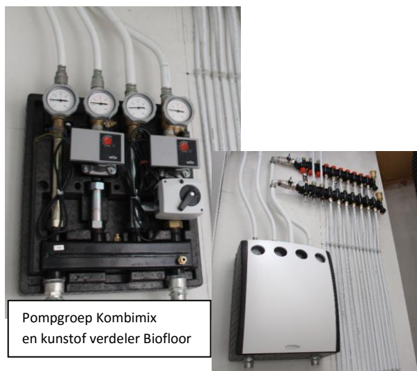
Pompgroep Kombimix en kunststof verdeler Biofloor

Complete renovatie van het verwarmingssysteem van een appartement in Brussel. Het bijzondere hieraan is de plaatsing van een vloerverwarming op lage opbouwhoogte en in droogstelsel.