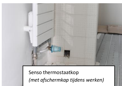
Senso thermostaatkop (met afschermkap tijdens werken)